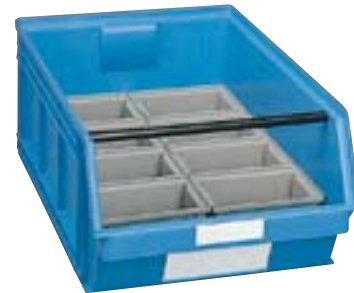
1 contenedor Art. PL8951 8 cajas divisorias Art. PJ2551