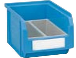
1 contenedor Art. PM2551 1 cajas divisorias Art. PP1551