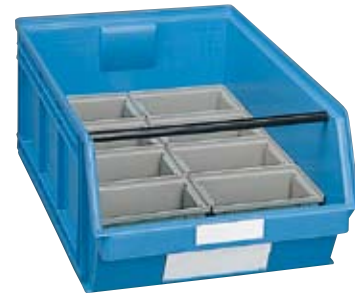
1 contenedor Art. PL8951 8 cajas divisorias Art. PJ2551