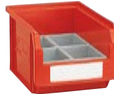
1 contenedor Art. PM2551 1 cajas divisorias Art. PP2051