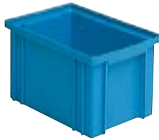
Art. PJ2551 200x140x130h mm