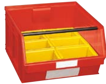
1 contenedor Art. PL8151 6 cajas divisorias Art. PJ2551