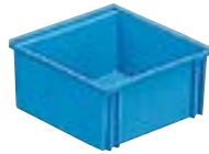
Art. PJ1751 145x140x70h mm (Solo en color azul)