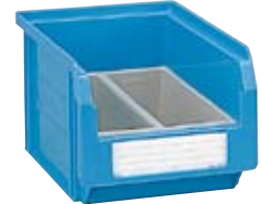
1 contenedor Art. PM2551 1 cajas divisorias Art. PP1551