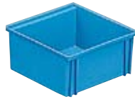
Art. PJ1751 145x140x70h mm (Solo en color azul)