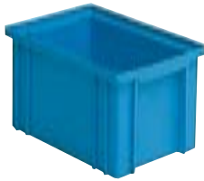
Art. PJ2551 200x140x130h mm