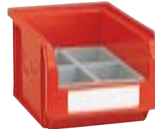
1 contenedor Art. PM2551 1 cajas divisorias Art. PP2051