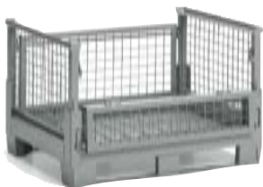
Contenedor plegable 1000x800 mm