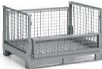
Contenedor plegable 1200x1000 mm