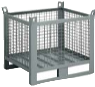
CONTENEDORES DE MALLA SIN PUERTA Dim. 1000x800x800h mm