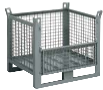
CONTENEDORES DE MALLA CON PUERTA Dim. 1000x800x800h mm