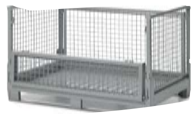
Contenedor plegable 1500x1000 mm