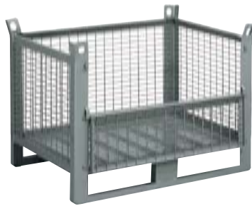
CONTENEDORES DE MALLA CON PUERTA Dim. 1200x800x800h mm