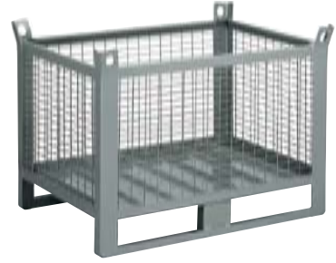
CONTENEDORES DE MALLA SIN PUERTA Dim. 1200x800x800h mm