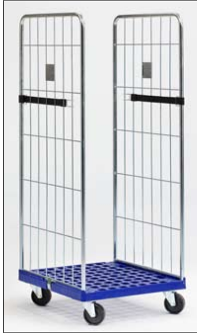
Art. RC-P Accesorios disponibles: Bandeja intermedia Art. BI-RC Rejilla trasera Art. RT-RC-P Barra superior Art. BS-RC