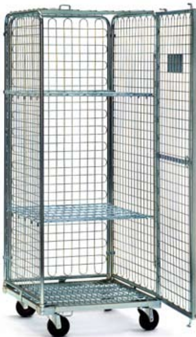
Art. RC-S1 Malla de 50x50 mm Accesorios disponibles: Bandeja intermedia Art. BI RC-S1