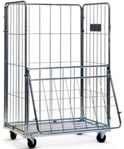
Art. RC-MP Accesorios disponibles: Artículo con puerta Art. RC-M Artículo sin puerta