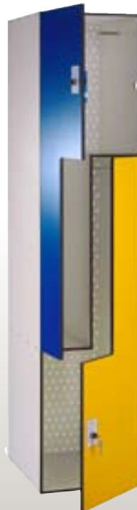
PLF4-1x2 400x500x1800h mm