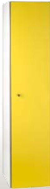
Art. RF40-1 Dim. 400x500x1800h mm