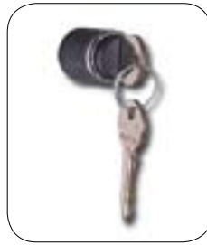
Cerradura con 2 llaves Opcional: Cerradura a moneda Cerradura para candado