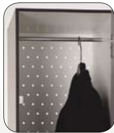
Barra para perchas. No disponible estante superior