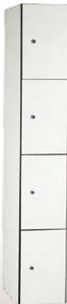
Art. TF30-1x4 Dim. 300x500x1800h mm