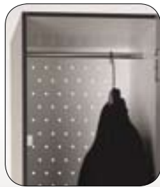
Barra para perchas. No disponible estante superior