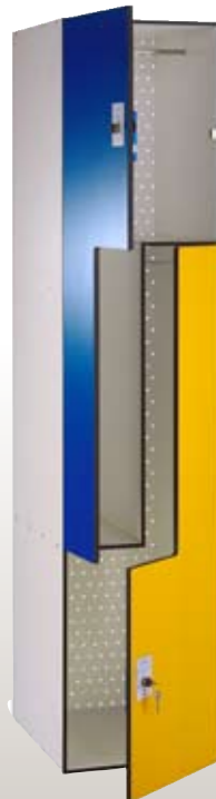
PLF4-1x2 400x500x1800h mm