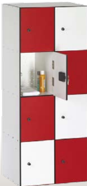
Art. TF50-2x8 Dim. 1000x500x1800h mm