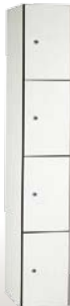
Art. TF30-1x4 Dim. 300x500x1800h mm