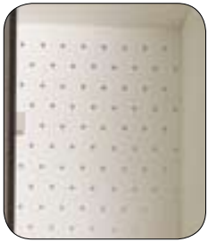
Panel trasero perforado

Todos los modelos vienen equipados con cerradura y juego de 2 llaves por puerta, aunque opcionalmente pueden instalarse cerraduras para candado o de moneda.