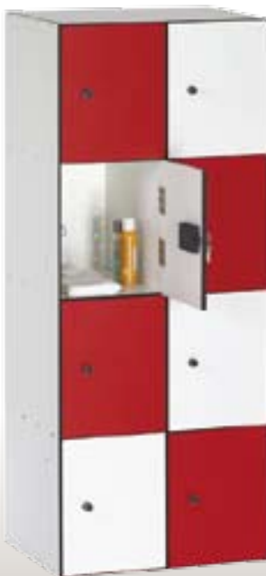
Art. TF50-2x8 Dim. 1000x500x1800h mm