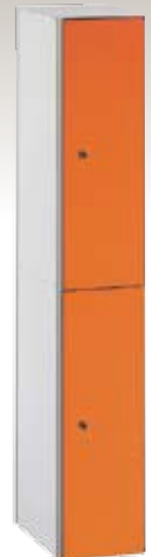
Art. TF30-1x2 Dim. 300x500x1800h mm