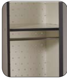
Estante superior y barra para perchas