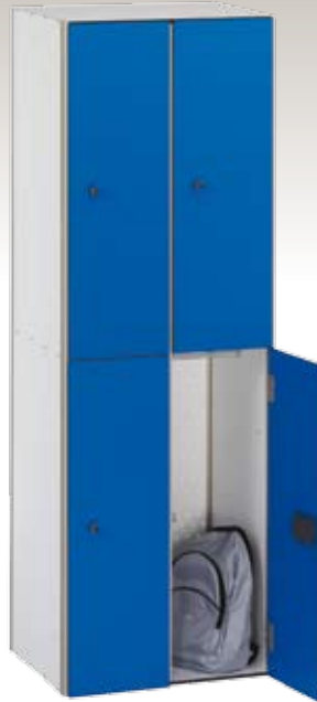
Art. TF30-2x4 Dim. 600x500x1800h mm