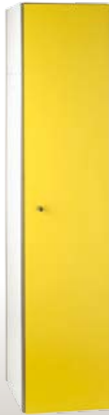
Art. RF40-1 Dim. 400x500x1800h mm