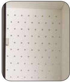
Panel trasero perforado

Todos los modelos vienen equipados con cerradura y juego de 2 llaves por puerta, aunque opcionalmente pueden instalarse cerraduras para candado o de moneda.