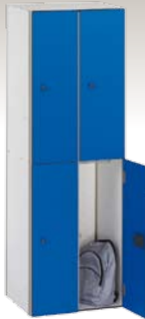
Art. TF30-2x4 Dim. 600x500x1800h mm