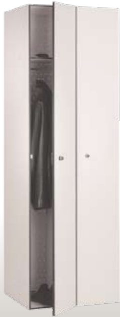
Art. RF30-2 Dim. 600x500x1800h mm