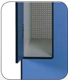
Cantos interiores redondeados