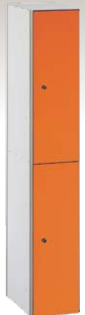
Art. TF30-1x2 Dim. 300x500x1800h mm