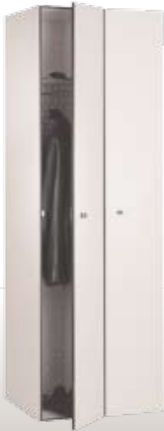
Art. RF30-2 Dim. 600x500x1800h mm