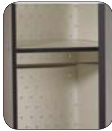
Estante superior y barra para perchas