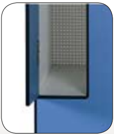
Cantos interiores redondeados