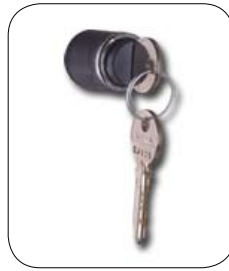
Cerradura con 2 llaves Opcional: Cerradura a moneda Cerradura para candado