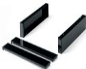
Art. RR1635 + RR064501 Zócalo de 200h mm para manipulación con tranpaleta + tapa frontal