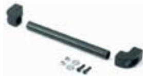
Art. AG9300 Tirador