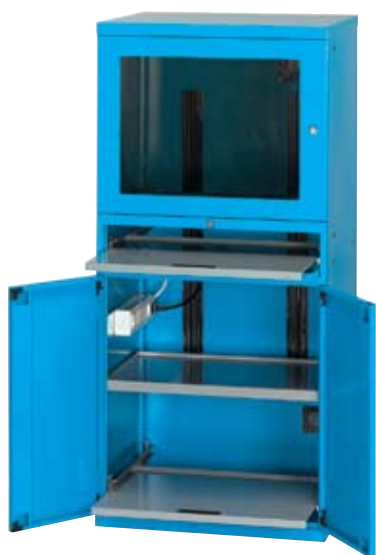
Art. AS160112 Equipado con 2 estantes regulables, 1 estante para teclado y 1 estante extraíble Dim. 717x635x1560h mm