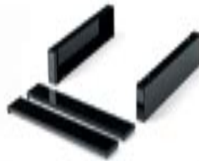
Art. RR1635 + RR064501 Zócalo de 200h mm para manipulación con transpaleta + tapa frontal