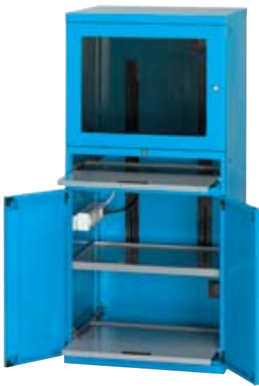
Art. AS160112 Equipado con 2 estantes regulables, 1 estante para teclado y 1 estante extraíble Dim. 717x635x1560h mm