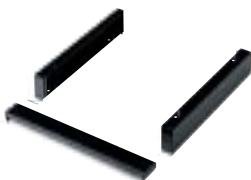
Art. RR1625 + RR0645 Zócalo de 100h mm para manipulación con tranpaleta + tapa frontal