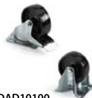
2 Art. CRNAD10100 2 Art. CRNBAD10100 Juego de 2 ruedas fijas + 2 ruedas giratorias con freno Ø 100 de nylon