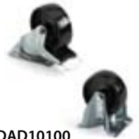
2 Art. CRNAD10100 2 Art. CRNBAD10100 Juego de 2 ruedas fijas + 2 ruedas giratorias con freno Ø 100 de nylon