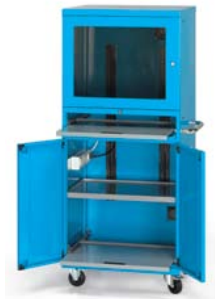
Art. AS160113 Dim. 717x635x1690h mm Con juego de 2 ruedas fijas + 2 ruedas giratorias con freno Ø 100 de nylon