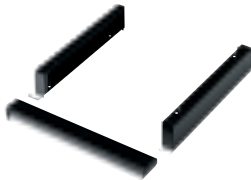
Art. RR1625 + RR0645 Zócalo de 100h mm para manipulación con transpaleta + tapa frontal