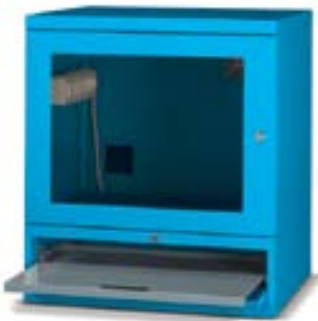
Art. AS0801 Equipado con 1 estante regulable y 1 estante porta teclado. Dim. 717x635x810h mm