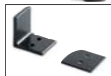
Art. AS2250 Soporte multiuso.