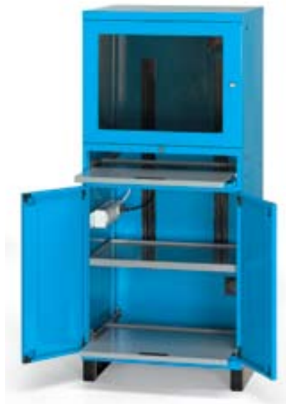
Art. AS160114 Dim. 717x635x1660h mm Con zócalo de 100h mm para manipulación con transpaleta