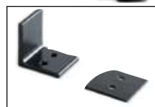
Art. AS2250 Soporte multiuso.