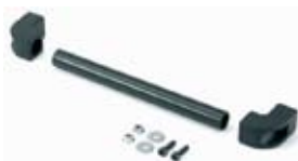
Art. AG9300 Tirador