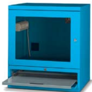
Art. AS0801 Equipado con 1 estante regulable y 1 estante porta teclado. Dim. 717x635x810h mm