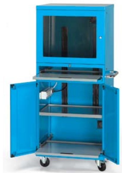
Art. AS160113 Dim. 717x635x1690h mm Con juego de 2 ruedas fijas + 2 ruedas giratorias con freno Ø 100 de nylon