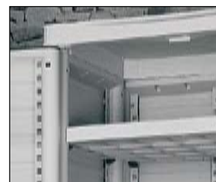
Estantes regulables en altura cada 32 mm, con seis puntos de anclaje.