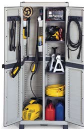
Art. BASE3700C 700x438x1818h mm 4 estantes regulables 4 cubetas porta objetos 2 colgadores