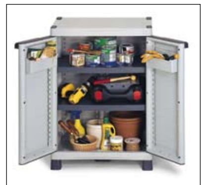
Art. BASE700C Dim. 700x438x976h mm