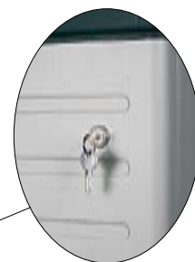
Art. BASE2350SC 350x438x1818h mm 2 estantes regulables 1 barra perchero 1 cubeta porta objetos 1 Cerradura con llave