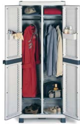
Art. BASE3700SC 700x438x1818h mm 4 estantes regulables 2 cubetas porta objetos 2 barras perchero