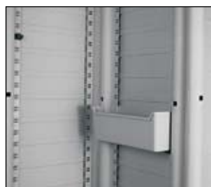
Laterales internos equipables con cubetas porta objetos.