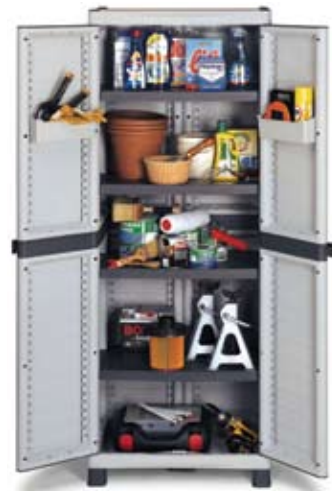
Art. BASE2700C 700x438x1818h mm 4 estantes regulables 2 cubetas porta objetos