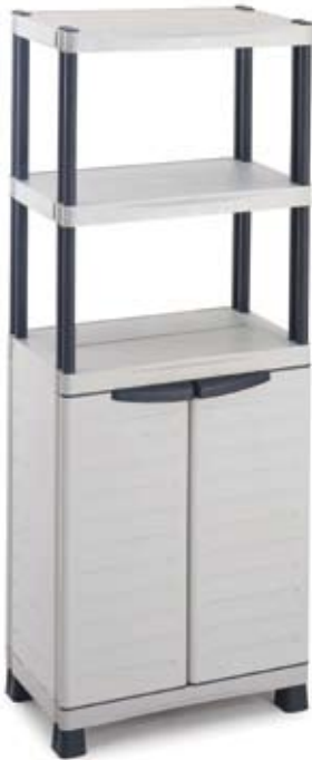
Art. BASE702C Dim. 700x438x1818h mm