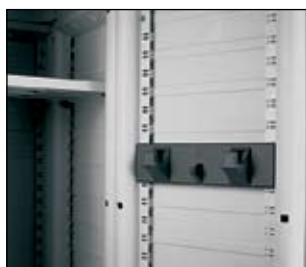
Puertas equipables con colgadores por la parte interna.