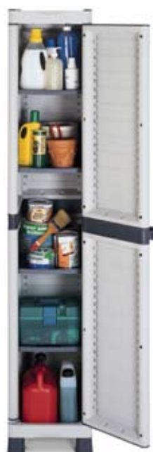
Art. BASE2350RC 350x438x1818h mm 4 estantes regulables