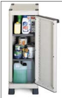
Art. BASE350C Dim. 350x438x976h mm