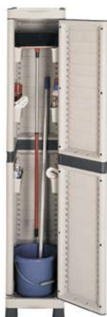
Art. BASE2350C 350x438x1818h mm 6 cubetas porta objetos