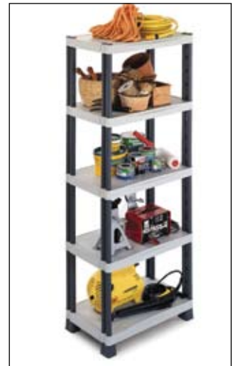
Art. MODULO705C Dim. 700x438x1818h mm