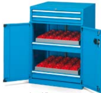
Art. AE104017 Dim. 717x597x1000h mm. Art. AE304019 Dim. 717x750x1000h mm. Conos porta-herramientas no incluidos.