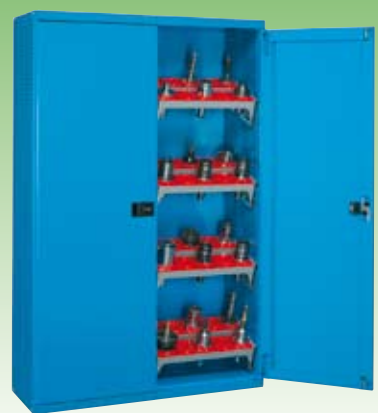
Art. NC021101 (NC 2521-01) Dim. 1290x495x2000h mm. Compuesto de: 1 NC0211 + 16 NC5020 + 16 NC5711 (Conos no incluidos)