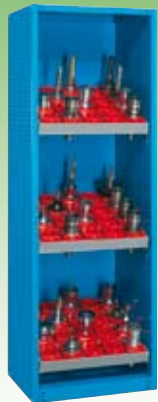
Art. NC012001 (NC 1620-01) Dim. 660x620x2000h mm. Compuesto de: 1 NC 0120 + 3 NC 5220 + 3 NC5741 (Conos no incluidos)