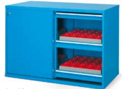
Art. AF104016 Dim. 1434x632x1000h mm. Art. AF304018 Dim. 1434x785x1000h mm. Conos porta-herramientas no incluidos.