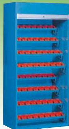
Art. NC082204 (NC 822-04) Dim. 1042x640x2200h mm. Compuesto de: 8 Estructuras NC5050 8 Pares de soprtres inclinados NC5711