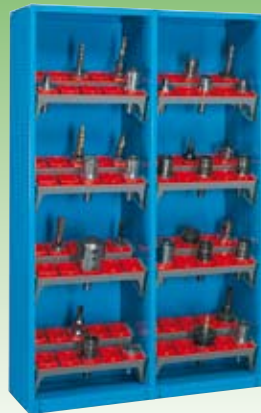
Art. NC021001 (NC 2520-01) Dim. 1290x470x2000h mm. Compuesto de: 1 NC0110 + 1 NC0110X0 + 16 NC5020 + 16 NC5711 (Conos no incluidos)