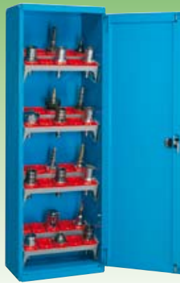
Art. NC011101 (NC 1521-01) Dim. 660x495x2000h mm. Compuesto de: 1 NC0111 + 8 NC5020 + 8 NC5711 (Conos no incluidos)