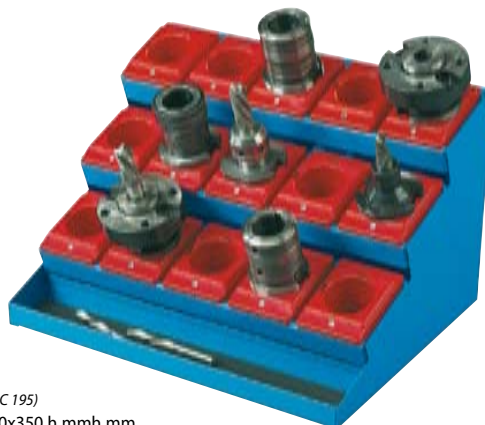
NC2010 (NC 195) Dim. 565x450x350 h mmh mm.

Este funcional soporte puede contener conos porta-herramientas dispuestos en tres filas, ligeramente inclinadas hacia delante para facilitar su toma, y a diferentes niveles. Permite disponer de las herramientas sobre un banco de trabajo, armario o carro.