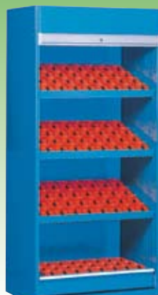
Art. NC082207 (NC 822-07) Dim. 1042x640x2200h mm. Compuesto de: 3 Estructuras de 4 filas NC5250 3 Pares de soportes inclinados NC5741 1 Estructura de 3 filas NC5140 1 Par de soportes NC5630 1 Cajon NC8915