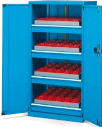
Art. AE405815 Dim. 717x750x1450h mm. Conos porta-herramientas no incluidos.

Los armarios series AE y AF son especialmente indicados para el almacenaje vertical de herramientas. En las diferentes medidas disponibles, estos armarios pueden estar equipados con puertas batientes o correderas, estantes regulables o extraíbles y cajones de diferentes alturas, en los que pueden colocarse estructuras y bandejas porta-conos.