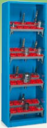
Art. NC011001 (NC 1520-01) Dim. 660x470x2000 h mm. Compuesto de: 1 NC0110 + 8 NC5020 + 8 NC5711 (Conos no incluidos)